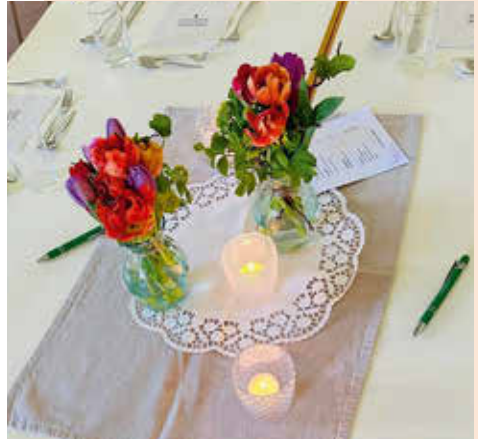
Wir geben uns Mühe für Euch...