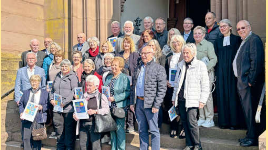
Jubiläumskonfirmation in Schopfheim am 22. März: Jubilarinnen und Jubilare aus verschiedenen Jahrgängen feiern gemeinsam. Freude über erlebte Gemeinschaft und Dankbarkeit für Geglücktes, Geschenktes, auch Durchgestandenes ... alles vereint sich an diesem Tag!