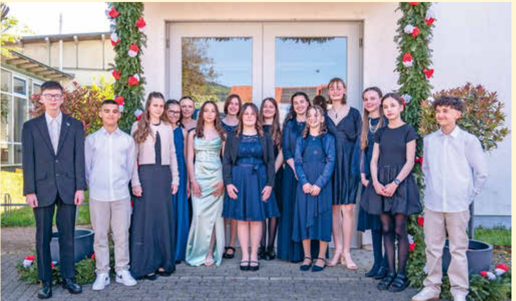
Konfirmation in Fahrnaun am 25. April: Rosen auch hier - aber an der Tür, von Eltern und Kindern gemeinsam liebevoll gekränzt. Weil so vielen Jugendlichen ihre Konfirmation wichtig war, wurden in Schopfheim und Fahrnaun jeweils zwei Gottesdienste gefeiert.