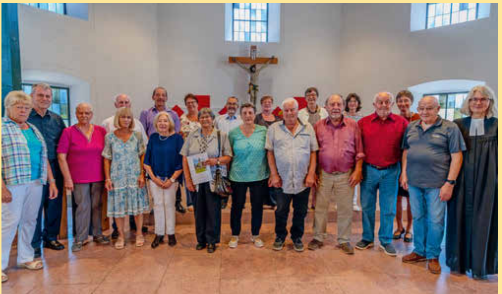
Jubiläumskonfirmation in Gersbach am 21. Juni: Man kennt sich noch ... auch wenn manche von weiter angereist sind. Jede und jeder spürt Gottes Segen für sich persönlich.