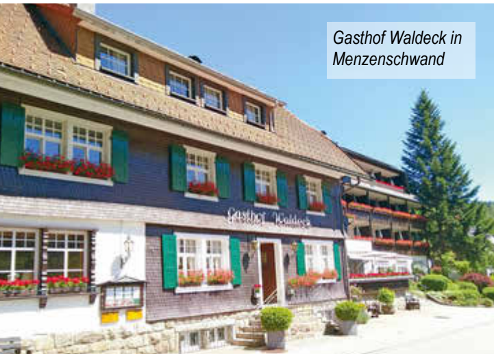
Gasthof Waldeck in Menzenschwand

So fuhr man früher auch in Gersbach durch den Schnee