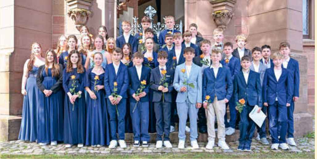
Konfirmation in Schopfheim am 18. April 2026: Fröhlich feiern die Jugendlichen mit ihren Familien das Fest ihres Glaubens. Die Rose ist wie ein Segenswunsch: Möge Gott Euer Leben zum Blühen bringen und Euch die Schönheit eures Weges zeigen!